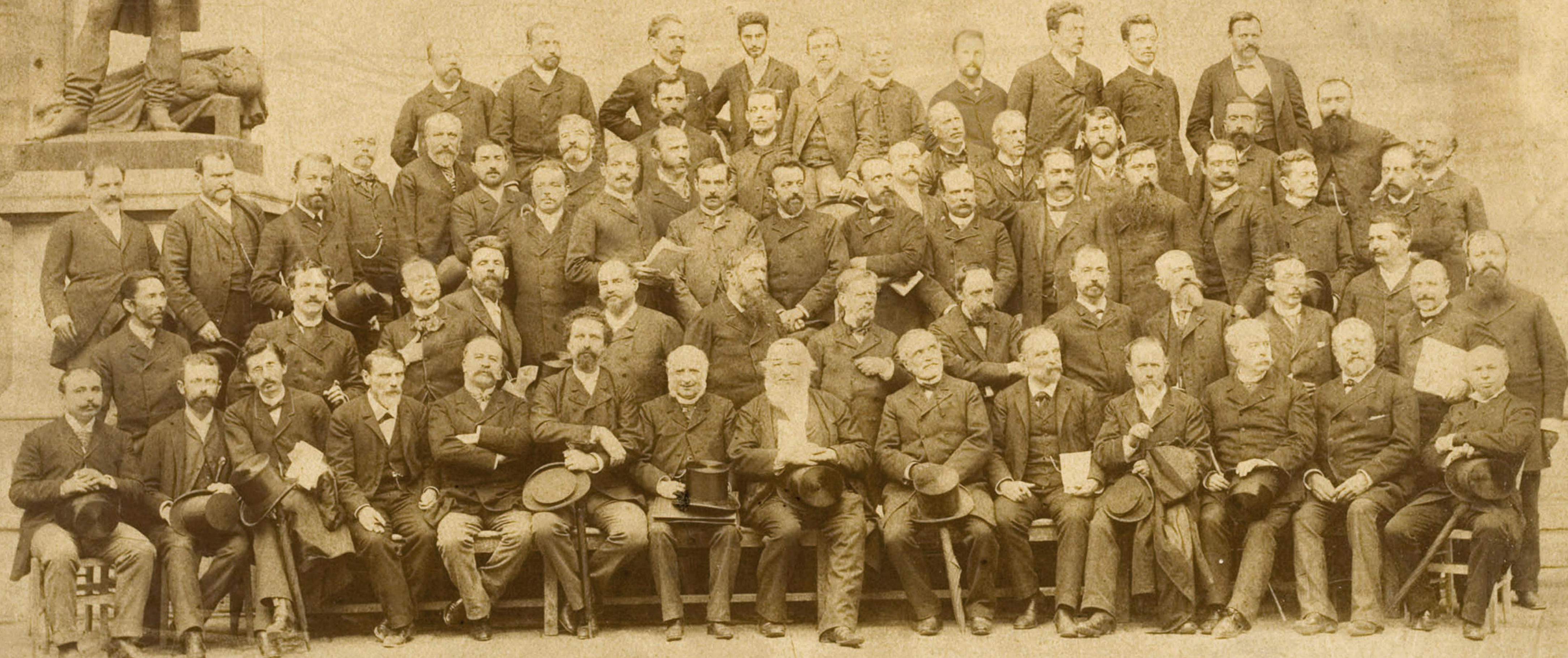
TARDE BENEDIKT LACASSAGUE FERRI MOTET MOLESCHOTT ROUSSEL MANOUATHIER LOMBROSO